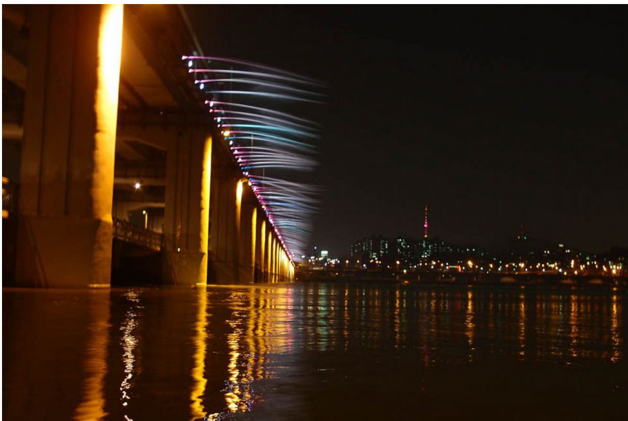
Fontána přes na mostě přes řeku Han, Soul