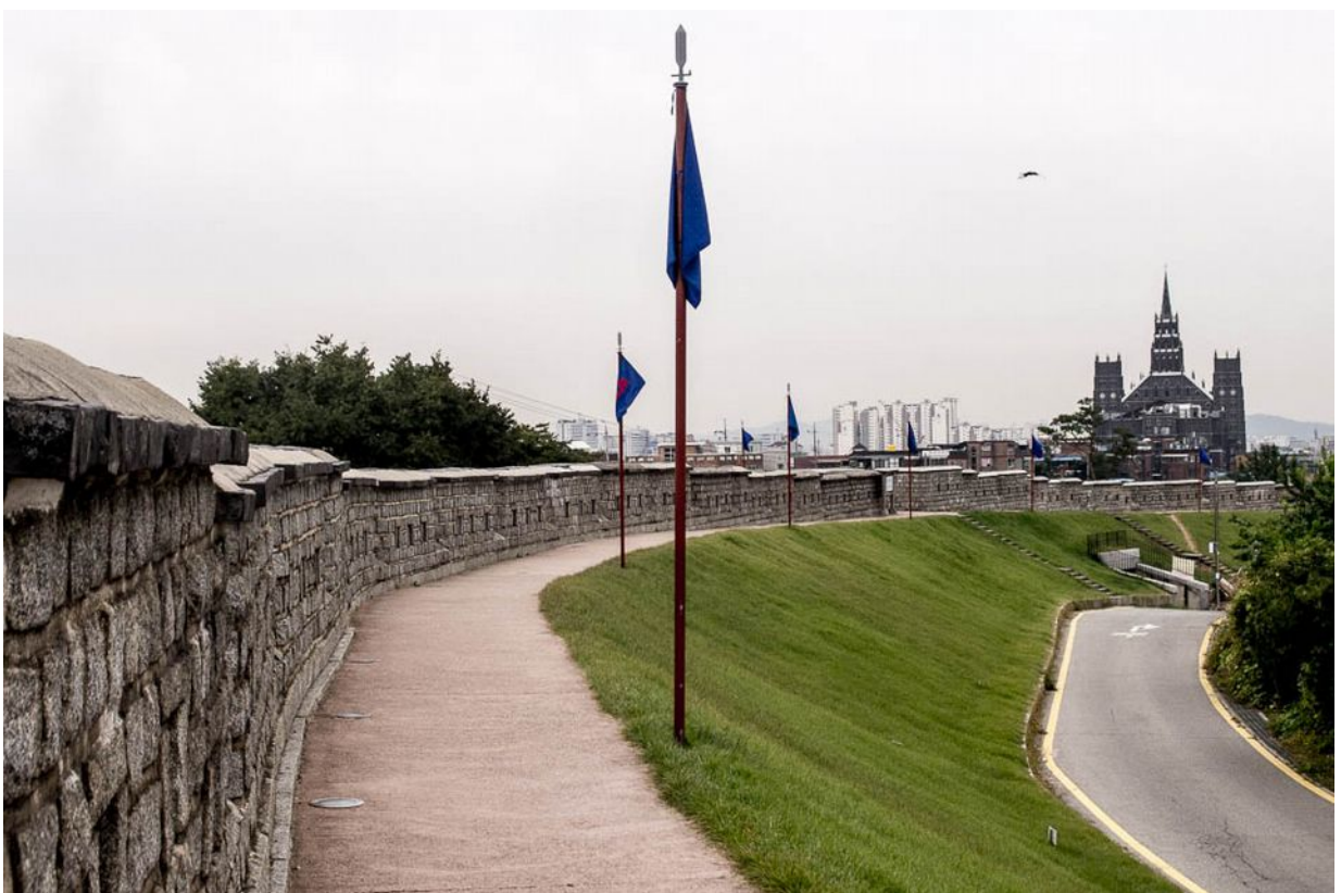
Pevnost Hwaseong, Suwon, UNESCO památka