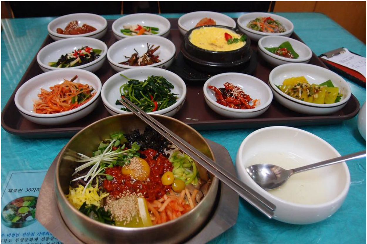
Bibimpab, korejská specialita