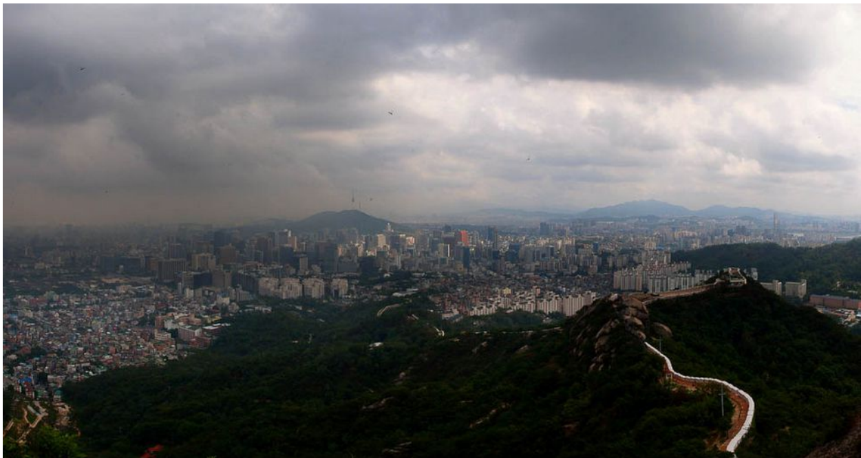
Pohled na Soulu z Bukaksan