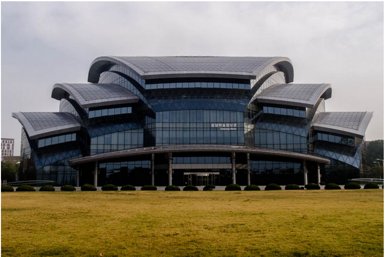
Samsung Library, Kampus v Suwonu