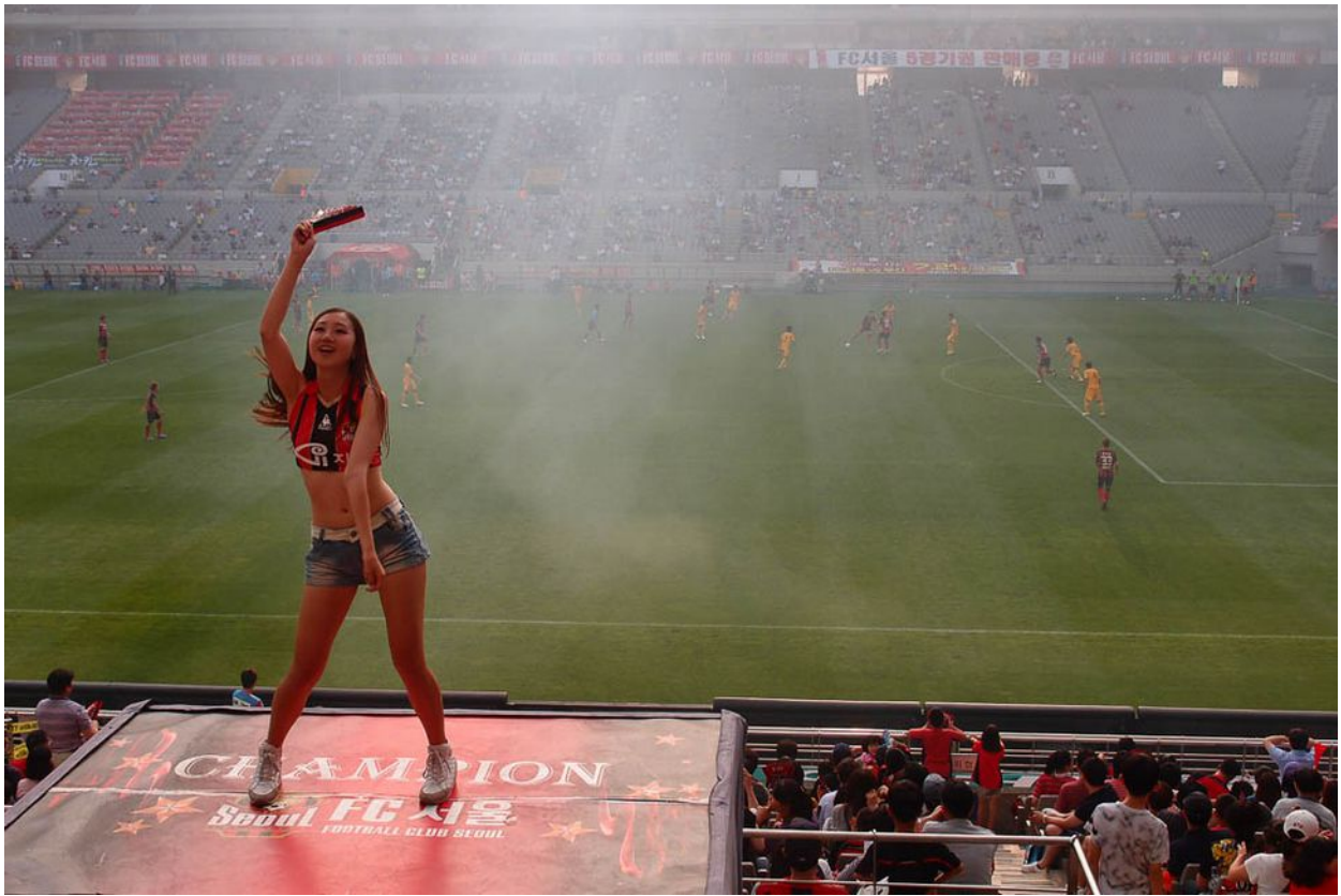
Korejské roztleskávačky, fotbalový stadion v Soulu