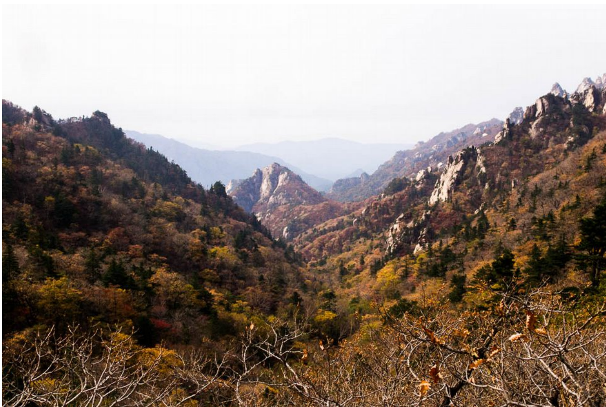
Národní park Seoraksan