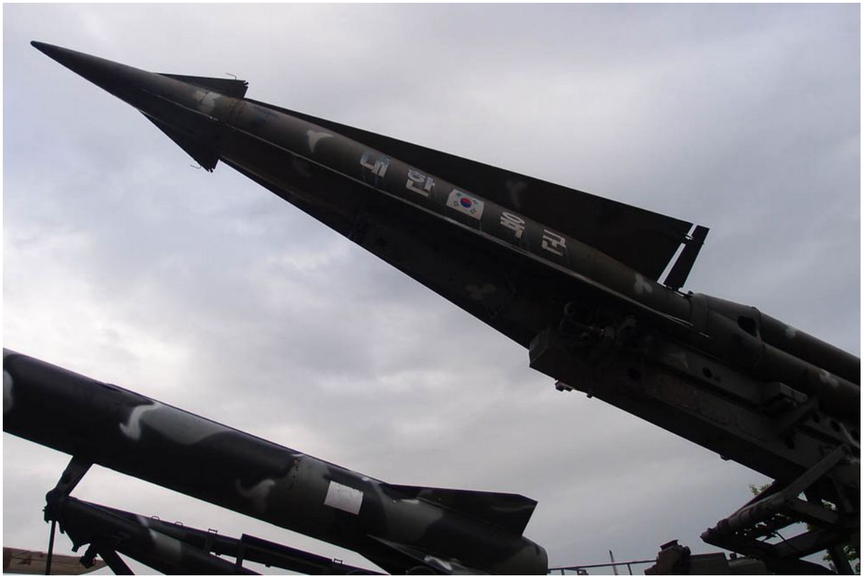
Památník Korejské války